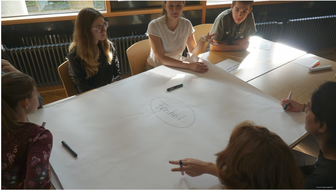
FSG Marbach – Workshop mit Schüler der Oberstufe zum Thema Freiheit und Europa